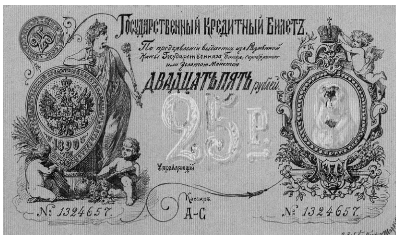
Рис. 1. А.И. Шарлемань. Проект л. с. государственного кредитного билета достоинством 25 рублей. 1890 г. Собрание АО «Гознак»