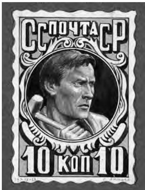
Рис. 1. О.Ф. Амосова-Бунак. Нереализованный эскизный проект почтовой марки «Рабочий». 1928 г. ЕФОД

хозяйства с автографом О.Ф. Амосовой-Бунак и датой: 21 декабря 1927 г. (ЕФОД. П.5-215-в). Именно этот эскиз (с некоторыми изменениями) станет основой выпущенной облигации.