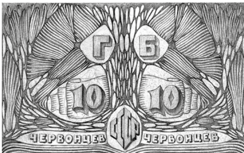
Рис. 3. О.Ф. Амосова-Бунак. Нереализованный эскизный проект водяного знака банкноты номиналом 10 червонцев. 1928 г. ЕФОД