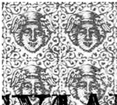
Рис. 2. Фрагмент сетки л.с.

Сравнение этих проектов с билетами образца 1843 г. показывает, что у них тоньше и изящнее рисунков «архитектурной» рамки на л.с. и гербового орла на о.с.; значительно усложнен рисунок сетки на л.с., где появились изображения Меркурия (рис. 2) и текст «ГОСУДАРСТВЕННЫЙ КРЕДИТНЫЙ БИЛЕТЪ», причем сетка не сплошная – не перекрывается «архитектурной» рамкой; л.с. на части проектов отпечатана не в три, а в четыре прогона (разноцветная сетка 1; «архитектурная» рамка 2; «окна» для гербов, номинала, даты и номеров внутри рамки 3; герб, дата, цифра номинала и основной текст 4). На части проектов «окна» (3) отпечатаны вместе с рамкой (2) в одну краску. На о.с. применена темная рамка с белым текстом (5); пропись о.с. отпечатана не в один, а в два прогона – отдельно рамка (5) и остальное наполнение (6). Водяной знак на проектах также отличается от билетов образца 1843 г. В центре внизу – цифры номинала в овале, а по краю банкноты – рамка из крупных точек (7) и внутри этой рамки по углам еще четыре точки (8). Рамка из точек на водяном знаке накладывается на рамку, отпечатанную