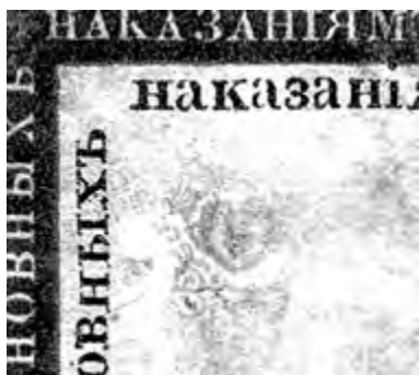
Рис. 3. Изображение Меркурия, просвечивающее на о.с. через «точку» водяного знака